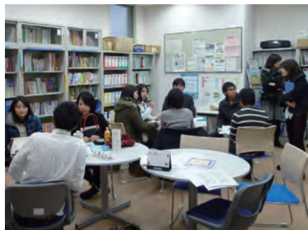
2 模擬集団面接を終え、先輩からの感想を聞く就活生のみなさん