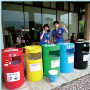
湖風祭では、DRP (Dish Return Project) や My はし推進運動、ゴミ分別などの取り組みにより環境にやさしい祭りを目指しています。[右下写真]