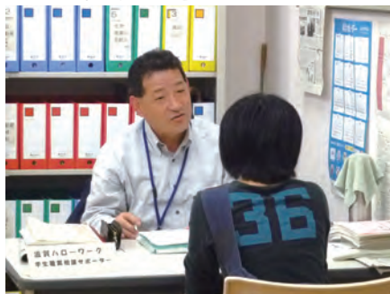
4 ハローワーク彦根からの出張就職相談の様子 出張就職相談! 毎週金曜日・不定期火曜日