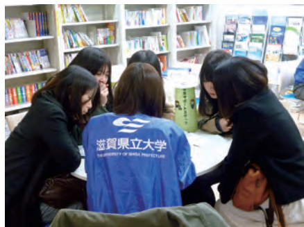
1 学生サポートスタッフによる就職相談会で先輩の話を真剣に聞く就活生のみなさん