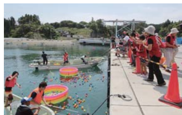
海の運動会(海の玉入れ)

なぜ行くのか?と聞かれればそれぞれに思いはありますが、「田の浦が好きだから」「田の浦の人に会いたいから」と答えます。もちろん活動を続ける理由が「好きだから」だけではありませんが、あの震災に負けずに復興へ立ち向かう田の浦の姿はかっこよく、尊敬しています。津波であまりにも多くのものを失われたはずなのにそれでも「海が好きなんだ、海と生きるんだ」と話す姿に心を打たれました。田の浦の方々や、実際に被災地に訪れることは、私たちにとってテレビや新聞からでは得られない、かけがえのない時間であり経験だと感じています。