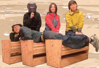
木作業所「もくれん」にて