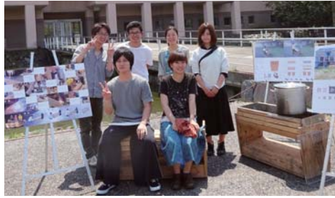
お手伝いいただいたみなさん