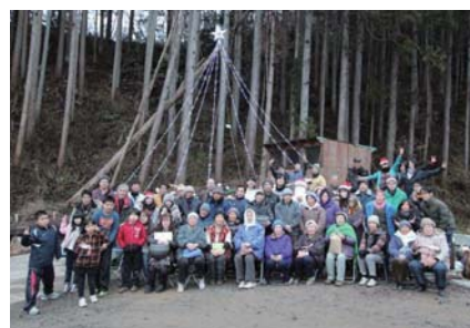
田の浦ファンクラブ学生サポートチーム

Facebook https://ja-jp.facebook.com/mokkopro/