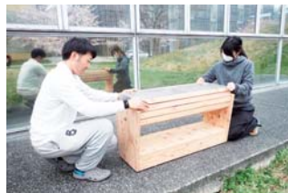
▲簡単にベンチからかまどへ変身