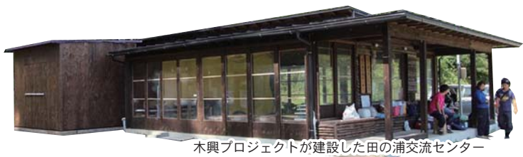
木興プロジェクトが建設した田の浦交流センター