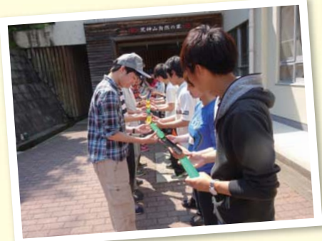
▲ボールを落とさずにゴールまで

学生からは「目標設定の仕方や声出しの重要性を学ぶことができた」「自分たちで考え行動する重要性を学べた」などの感想があり、課外活動を行う上でリーダーとして大切なことを学びました。