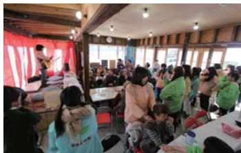
交流センターでミニライブ

活動の中で私たち学生は多くを学び、一回りも二回りも成長できていると毎年実感しています。田の浦のみなさんとの関わりは『復興支援』と単に言い切れるものではなく、さらに深みのある何かなのではないかと感じています。ボランティア活動として「田の浦の