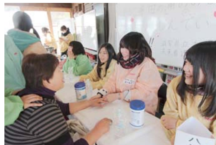
ハンドマッサージでリラックス

みなさんに健康に、生き活きとした時間を過ごしてもらおう!」という気持ちでイベントを行っています。私たち学生の方が関わら