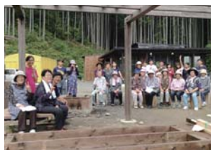
田の浦のおばあちゃんたちと