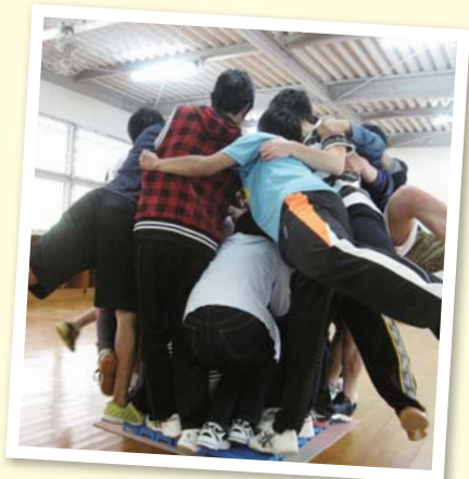
▲タイルの上に全員集合