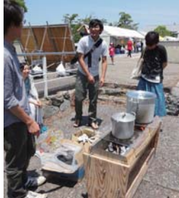
防災かまどベンチを使って豚汁の調理