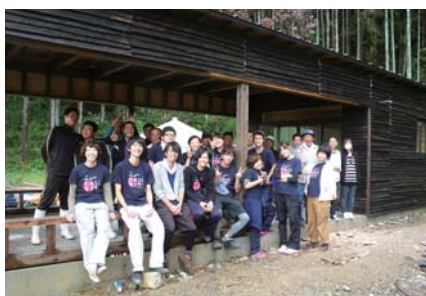
木興プロジェクト