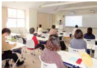
パワーポイントによる体験発表