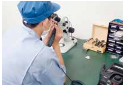
製造現場での実習の様子(8月)

インターンシップの体験は、これからの大学での学びやキャリア選択に活かされるものと確信しております。