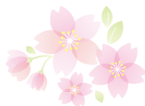
一昨年の 淡海能の様子

昨年は新型コロナウイルス感染症の影響で開催が中止となり、部員たちは“今年こそは”と昨年秋から練習に取り組んできました。現在は、残念ながら課外活動が停止していますが、各地の緊急事態宣言が解除され、移動が許される状況となりましたら、「淡海能」を開催する予定です。その際にはぜひ、学生たちの練習の成果をご覧に、春の彦根城へお越しください。