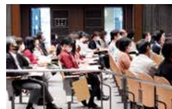
感染症対策として来場者へ手指消毒のお願いをし、出入口を開放して常時換気を行いました。