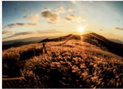
谷川 弘樹 「黄金に輝くススキ」 撮影場所:和歌山県生石高原 夕日によって、ススキが輝くま で待ちました。高原の広がり を魚眼レンズで表現しました。