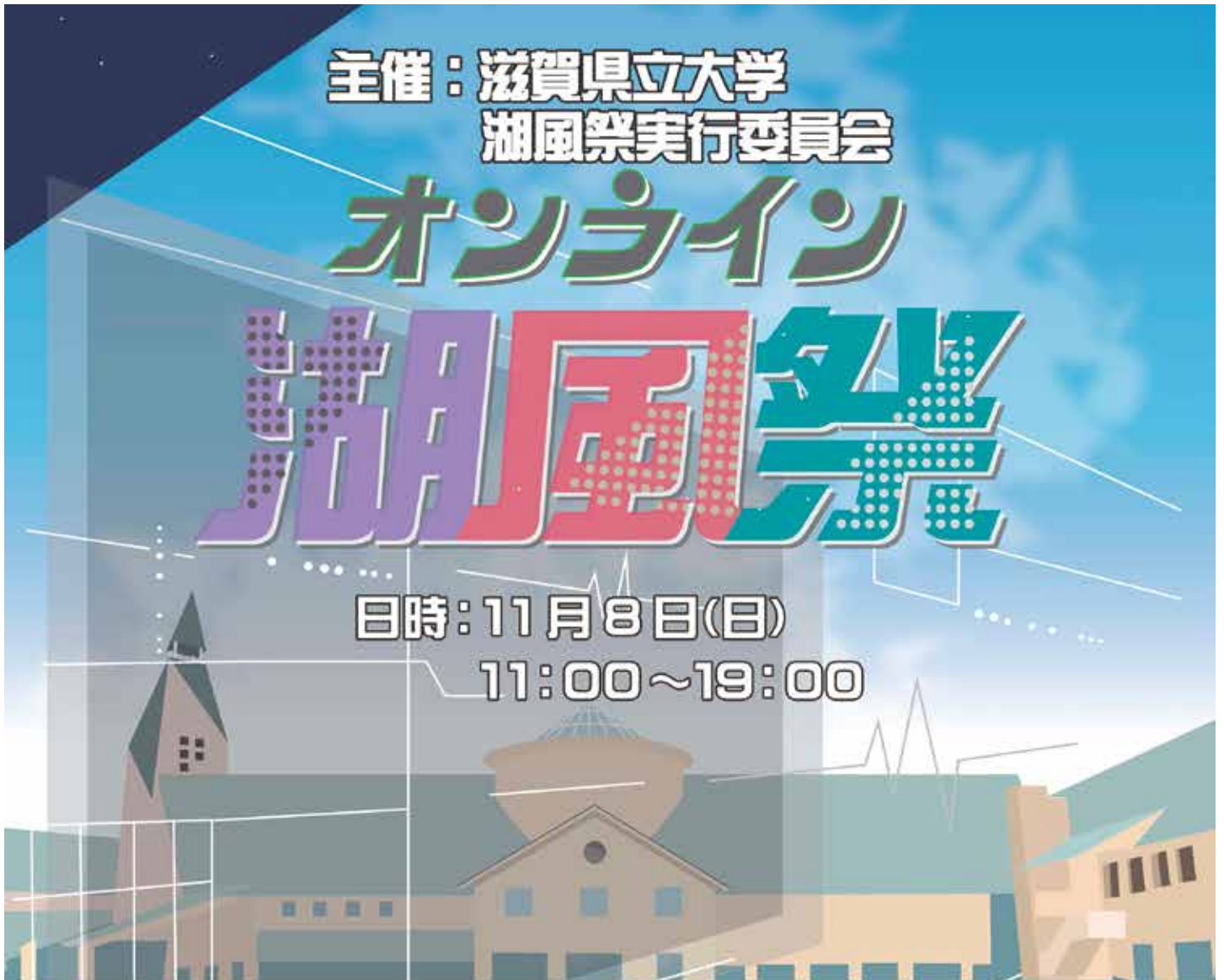
第26回 オンライン湖風祭ポスター(2020年)

昨年から猛威を振るう新型コロナウイルス感染症の影響で、大学の授業だけでなく、学生の課外活動にも変えざるを得ない大きな変化がありました。クラブ活動は春から活動自粛となり、毎年夏に開催される学園祭「湖風夏祭(うみかぜなつまつり)」も中止となりました。