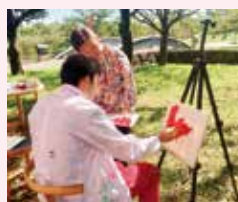
学生とペアで油絵の制作

2003年よりNPO法人障害者の就労と余暇を考える会メロディーの専属ボランティアとして、特別支援学校・学級、作業所などに通う自閉症やダウン症など他人とのコミュニケーションに困難が生じる障害児・者を支援する活動を継続して行っています。活動は、茶道や油絵など〈月1回の定例活動〉とみんなが楽しめるイベントとしてコンサートやお泊り会など〈毎年の恒例活動〉を学生が主体となって企画・実施しています。子どもたちが活動を楽しみ、他者と関わる力を発達させていく姿を見守りながら、学生も共に成長することを目指しています。