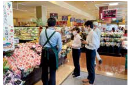
店舗実習前に指導を受ける様子(8月)