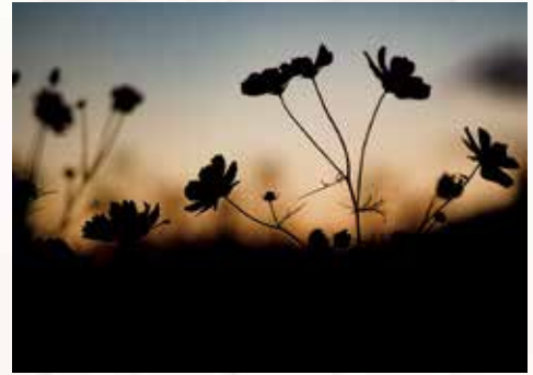
佐和 裕也 「秋桜」 秋の夕暮れがとても美しく、何かに生かせないかと 散歩していたら秋桜が咲いていたので即バシャリ!