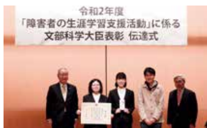
左から廣川学長、harmonyメンバー、倉茂理事