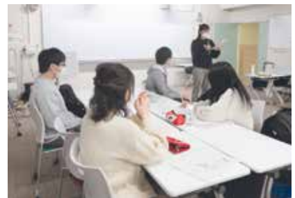
グループディスカッションの報告