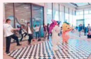
クリスマスコンサートのダンスショー