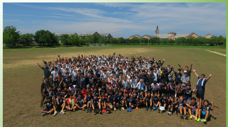
芝が元気に育つよう“W(草)”ポーズで記念撮影

なお、このイベントに参加してくださった、学生やボランティアの方々に提供されたカレー昼食について、後援会がその一部を助成をしています。