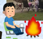
炎を囲んでまったり TAKIBI TALK

30周年記念バージョンとして、多くの企業から協賛をいただいた記念の花火は、本学卒業生である花火師が趣向を凝らした演出による花火と音楽の共演が大好評でした。→