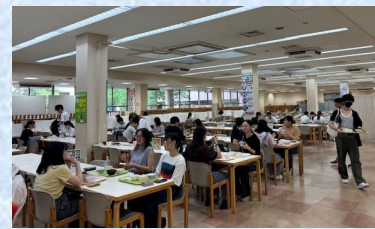
「どれにしよう…」好みのおかずを2品チョイス