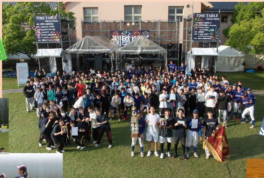
両校揃って記念撮影

↑ 観戦スタンプラリー (湖風夏祭模擬店 チケット、オリジナル タオルプレゼント)も 大好評でした！