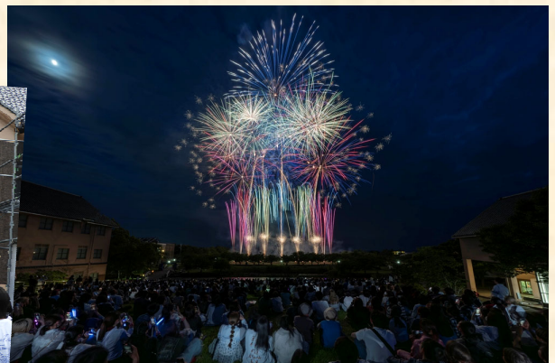
センター広場から花火を鑑賞する観衆

※後援会は、30周年記念祭の一部の事業や第28回京滋公立大学総合競技大会(京滋戦)、第27回湖風夏祭も助成をしています。