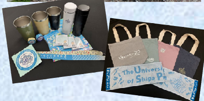
開学30周年記念グッズ (秋の湖風祭でも販売されます)