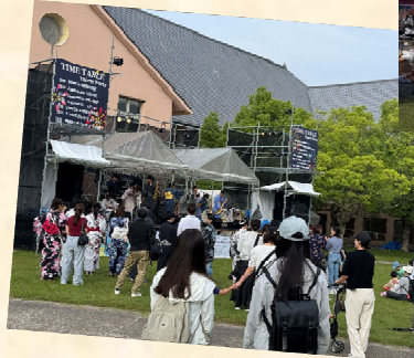
メインステージでのライブ