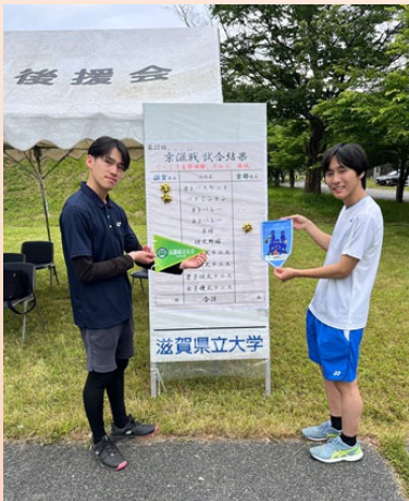
両校代表によるペナント交換

6月7日(土)に、本学で第28回京滋公立大学総合競技大会(京滋戦)を開催いたしました。地域の方々からも応援をいただき、試合はとても白熱したものとなりました。どの競技においても選手が全力を尽くす姿はとても感動的でした。結果、県立大が総合優勝し、湖風夏祭のステージで優勝旗を手にする事ができたことは、素晴らしい思い出になりました。応援、準備・運営に携わってくださった皆様のおかげで、京滋戦を成功させることができ、開学30周年記念祭を彩る大会になったと思います。この大会で得た経験と学びを、今後の人生に生かしていきたいと思います。どうもありがとうございました。