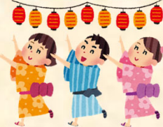
↑ 湖風祭でおなじみの滋賀県伝統芸能『江州音頭』タイム