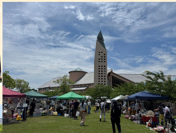
晴天に恵まれ賑わうフリーマーケット