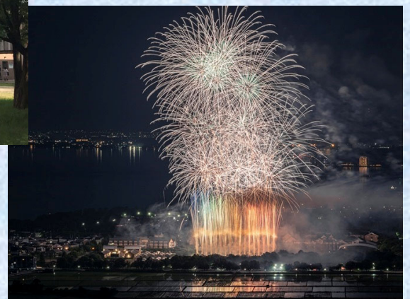
フィナーレを飾る30周年記念花火

30周年記念バージョンとして、多くの企業から協賛をいただいた記念の花火は、本学卒業生である花火師が趣向を凝らした演出による花火と音楽の共演が大好評でした。→