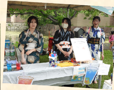
↑ 模擬店やキッチンカーも多数開店